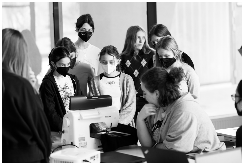
Abb. 3 Arbeiten mit TurtleStitch im Kinderbüro

zepten flexibel umgehen lernt. Gleichsam wurde Teamteaching und gruppenbasiertes Lernen erlebt und als wertvoll erachtet, ebenso wie der enge, transparente Austausch mit Kolleg*innen vor Ort und die gemeinsame, fachdidaktische Reflexion an der Universität. Das Erschließen außerschulischer Praxisfelder innerhalb des Studiums und das Zugreifen auf diese im späteren beruflichen Schulalltag ist, vor allem innerhalb des neuen Faches Technik und Design, für praktizierende (Jung-)Lehrer*innen, viele davon auch noch selbst Studierende, als zusätzlicher Handlungsort wesentlich geworden. Die gesammelte Praxiserfahrung im außerschulischen Bereich unterstützt Lehrer*innen nicht zuletzt beispielsweise durch ein neu gewonnenes Netzwerk. Strukturen und Angebote außerschulischer Kooperationspartner eröffnen dabei nicht selten räumliche und materielle Ressourcen, aus denen Studierende im späteren Berufsalltag gewinnbringend schöpfen können. Ein Praxiseinblick in ein Praktikum am Kinderbüro der Universität Wien veranschaulicht, wie digitales Sticken mittels des von Andrea Mayr-Stalder entwickelten Programms TurtleStitch im Zentrum stand.